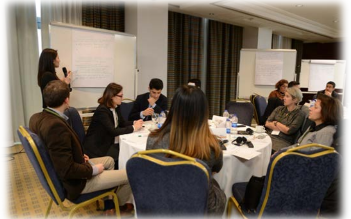
Çalıştay Grupları Fikir Üretim Çalışmaları ve Sunumlar