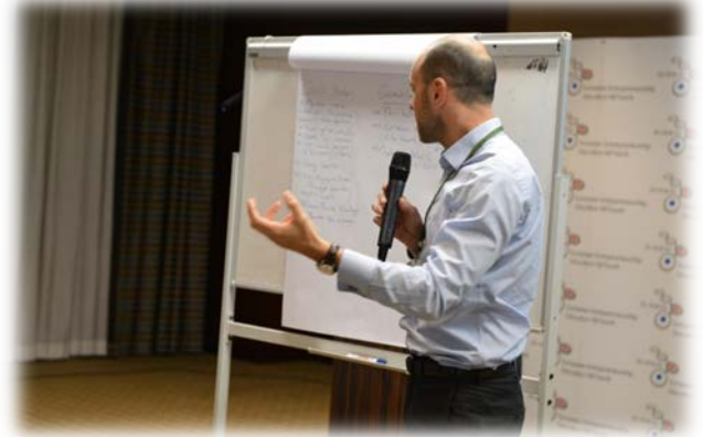
Çalıştay Grupları Fikir Üretim Çalışmaları ve Sunumlar